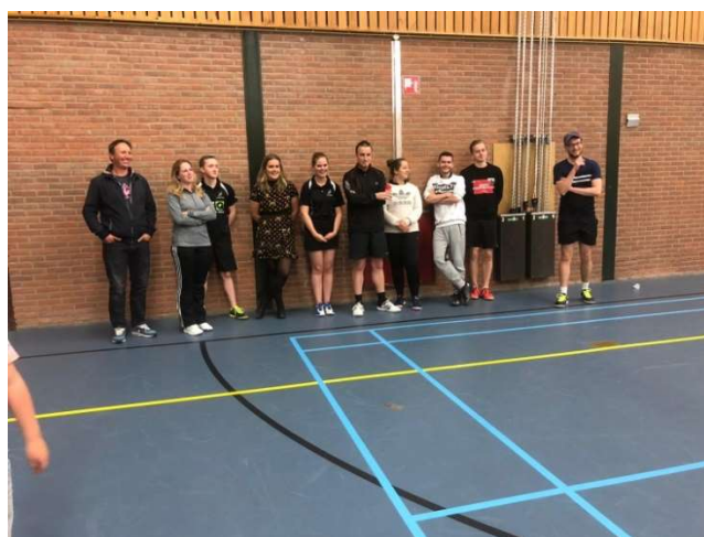
Het team vrijwilligers van jeugdkamp 2019.

En daarnaast bekendmaking van de resultaten van de inzameling van de ouders.